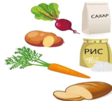
продукты, содержащие углеводы