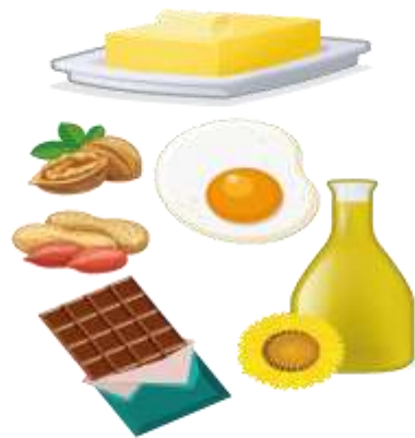
продукты, содержащие жиры